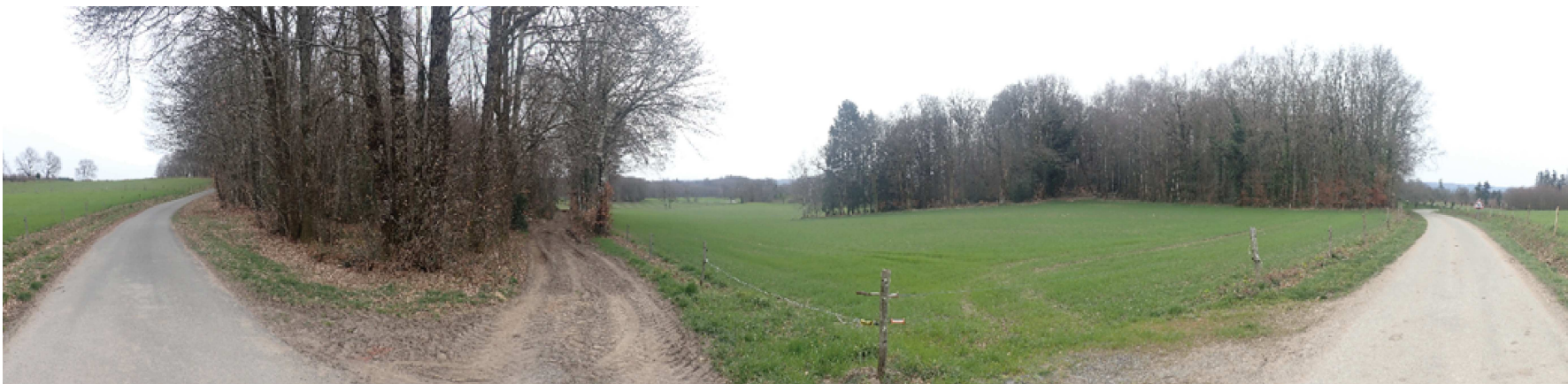
Paysage lointain 2 : Vue depuis le RD 48, vers le projet.