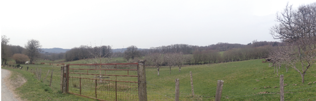
Paysage lointain 1 : Vue depuis le lieu-dit le Bois Neuf, vers le projet.