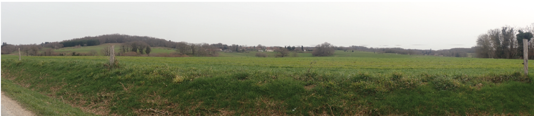
Paysage lointain 3 : Vue depuis la RD 57 à proximité de Sous Fransour, vers le projet.